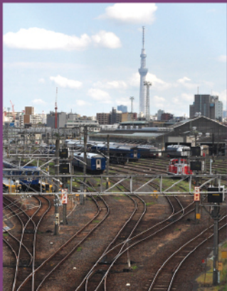
上中里さわやか橋から尾久車両センターを望む

新幹線や電気機関車の車両基地、引退した都電や蒸気機関車を見て歩く、鉄道のまち・北区ならではの散策コースです。飛鳥山にある小さなモノレール「アスカルゴ」に乗車するのもポイント。