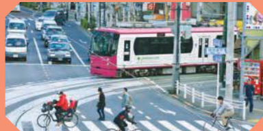
飛鳥山公園歩道橋

都電が一般道を走る珍しいスポット。歩道橋から見下ろせば、車と一緒に走る都電の姿が。春には飛鳥山の満開の桜をバックに走る姿も。