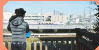
さくら亭横の展望デッキ

誰でも利用できるテーブルとベンチで、ランチしながら新幹線を眺められるので、お目当ての新幹線をのんびり待つならココ。散策の際の休憩にも。