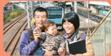
王子駅 南口 跨線橋

跨線橋の階段を上ると、JRのホームが間近に。その上には新幹線。跨線橋の下には宇都宮線・高崎線などが走り抜けます。電車の臨場感満点のスポット。