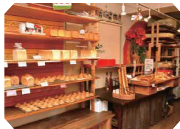
ロワンモニターニュ

王子本町1-15-20/営:9時30分~18時 日曜、第2・4土曜、祝日休/間:03(3900)7676