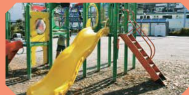
栄町ふれあい公園

園内には車両をかたどったトイレや、都電のレールを模した舗装など、電車好きにうれしいモチーフも。