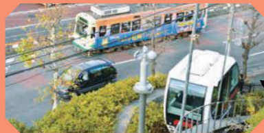
飛鳥山公園北側(アスカルゴ山頂駅)

アスカルゴに乗りながら、大きな窓から脇の車道を走る都電やJR王子駅のホームを眺められます。電車を見る角度が変化していくのも面白いです。