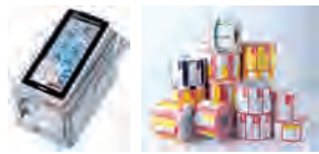
ラベルプリンターとシール