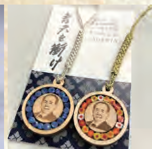
北区伝統工芸保存会×渋沢栄一翁

北区にゆかりのある渋沢翁とコラボした伝統工芸品も！ 飛鳥山おみやげ館でも販売しています。