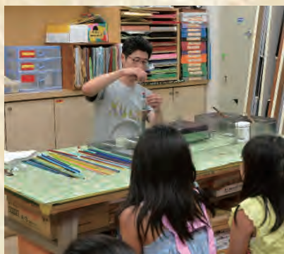
伝統工芸出張体験講座