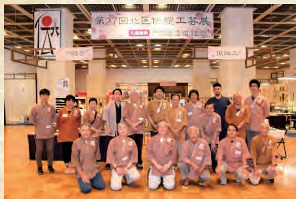
第27回伝統工芸展 集合写真 (令和元年9月)

平成4年11月に発足、現在会員は23名。 伝統的な技法・技術を継承し、伝統工芸のさらなる発展を目指して様々な活動を行っています。 日本の伝統的なものづくりの面白さを学んでもらいたいと、毎年秋に伝統工芸展を開催するとともに、区内の小学校・児童館では出張体験講座を開催しています。