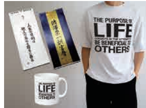
渋沢栄一の「訓言のデザイン」商品群 (株)岡田印刷 北区中十条2-8-9 ☎3908-4157