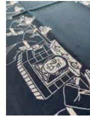
渋沢翁と王子の狐の行列手ぬぐい 河童屋 北区田端1-12-14 エチゴヤビル ☎090-9333-2232