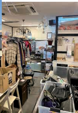
お店の入口と中の様子