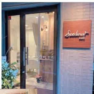
お店の入口と中の様子