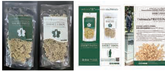
オートミール&プロテイン入りショートうどん・パスタ 玉川食品(株) 北区豊島7-5-12 ☎3913-5705