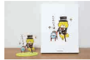
渋沢栄一×くまいぬ (コラボ企画商品) アケナギ(株) 北区赤羽1-59-8 ヒノビル4F ☎6821-1836