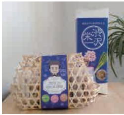
わらび餅すみ田 かりんとうパッケージ (株)トライアングル 北区西ヶ原1-64-4 ☎5980-7654