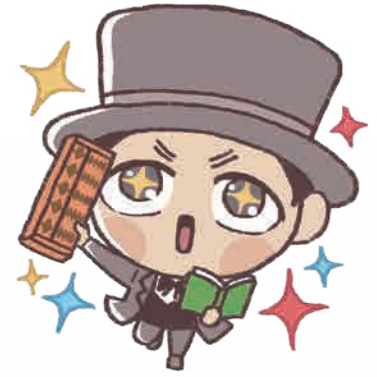
東京北区渋沢栄一プロジェクト 広報キャラクター しぶさわくん