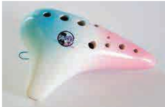
渋沢栄一翁キャラクターオカリナ (株)大塚楽器製作所 北区田端新町1-5-7 ☎3893-8422