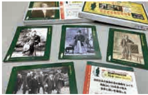
「グランド・オールド・マン」カード (株)新栄プロセス社 北区昭和町2-13-5 ☎3800-8691