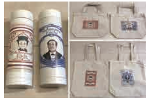
渋沢栄一翁ステンレスボトル、トートバッグ (株)トウボリクリエイティブ 北区王子4-25-8 ☎3919-1151