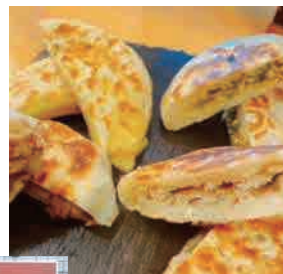
↑お店の名前にもなっているシャーピン(中華おやき)