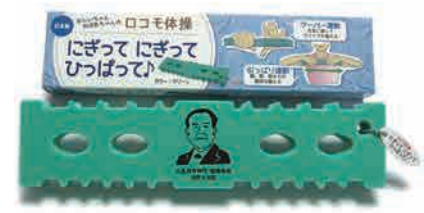
にぎってにぎってひっぱって (株)タコー 北区東十条1-10-13 スターオリンピック2F ☎5959-3366