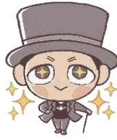
東京都北区渋沢栄一プロジェクト 広報キャラクター 「しづさわくん」

今後も北区で活躍する様々な事業者が、渋沢翁とコラボした商品を開発・販売していきますのでどうぞ楽しみに！(商品の購入に関しては、各事業者へお尋ねください。)