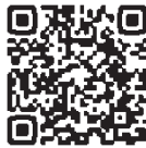
城北信用金庫 ホームページ (しづさわエール)