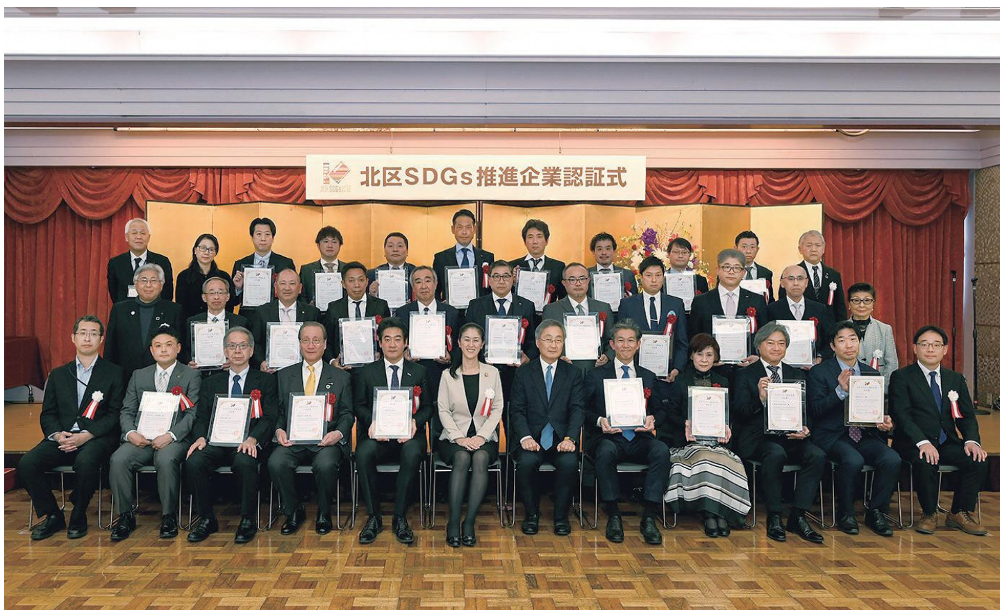
令和5年度北区SDGs推進企業集合写真