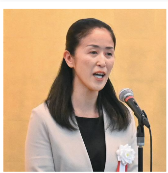
やまだ加奈子区長

今後は、SDGs認証企業の取り組み事例集を作成し、公表していくとともに、北区SDGsコミュニティを認証企業と共に開催し、SDGsの取り組みを区内に広げていきたいと考えています。