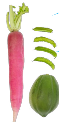
レディサラダ/四角豆/青パパイヤ

普段使いの野菜だけでなく、他ではあまり販売していない珍しい野菜も豊富です。調理法も店員さんが教えてくださいますよ。④