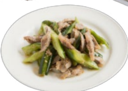
砂肝ときゅうりの中華風サラダ