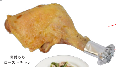
骨付もも ローストチキン