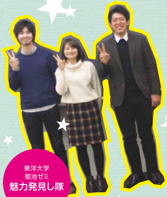
東洋大学 菊池ゼミ 魅力発見し隊