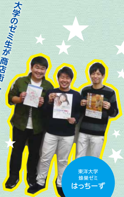
東洋大学 蜂巢ゼミ はっちーず