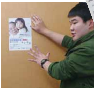
左: 北区全域の施設・店舗などを回り、掲示の交渉。チームだけでなく蜂巣ゼミ学生全員が協力し、5千枚を貼りました。

株式会社新栄プロセス社: シルクスクリーンによるPP製品(パッケージ・POP)などの印刷、機能印刷を手掛ける。カレンダーなど「シーキャッチ」製品の販促に取り組む。