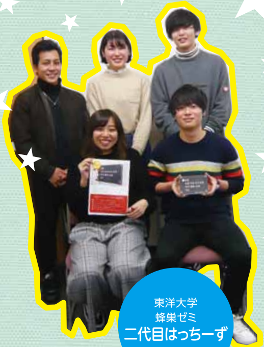
東洋大学 蜂巢ゼミ 二代目はっちーず