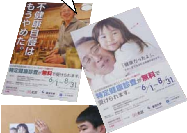
上: 学生のアイデアがデザイン化された、北区の「特定健康診査」啓発ポスター