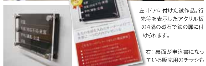
左: ドアに付けた試作品。行先等を表示したアクリル板の4隅の磁石で鉄の扉に付けられます。