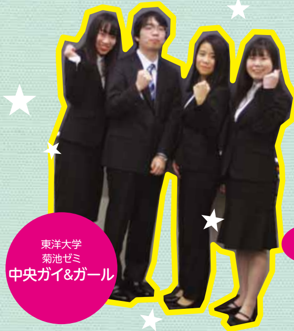
東洋大学 菊池ゼミ 中央ガイ&ガール