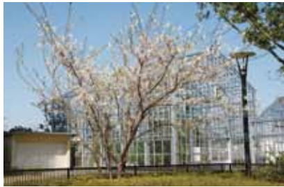
日本製紙の研究開発本部のエントランス前の桜は、かつて新宿区西落合にあった商品研究所に植えられていた桜から苗木をつくり、植栽したものです。

日本製紙株式会社 研究開発本部 〒114-0002 北区王子5-21-1 TEL:03-6665-1016 / 日本製紙株式会社 広報室 HP: http://www.nipponpapergroup.com/