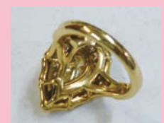
指輪の裏側もきれい

良いジュエリーを選ぶポイントとは？ 手にとって裏側をよく見てください。良いものは目に触れない部分まで丁寧に磨かれています。