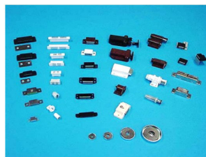
マグネットキャッチ