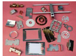
大きめの部品：細部にこだわった 高い完成度があります。