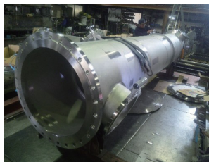
ハステロイ C-22 溶接加工品