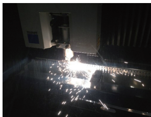
チタン2種レーザー切断