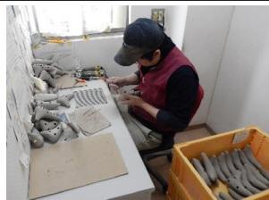
オカリナの調律作業