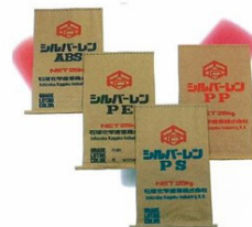
シルバーレーン樹脂（自社ブランド）