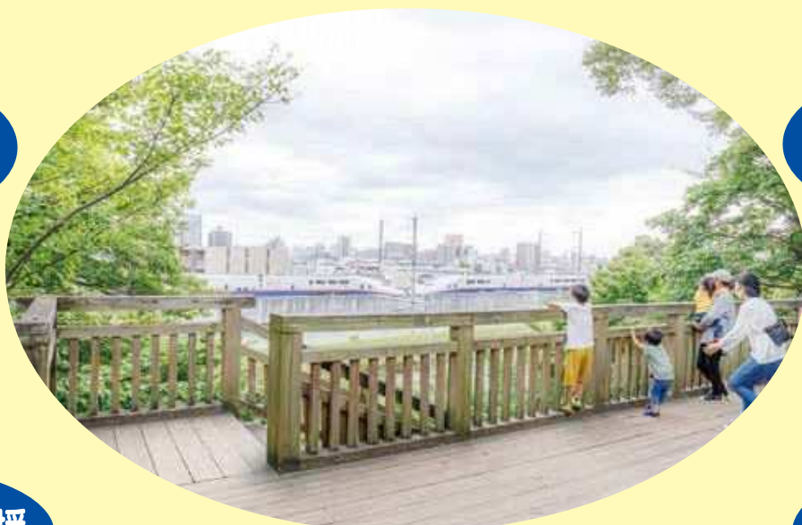
第11回北区観光写真コンテスト観光協会賞 鉄道部門「まっくすだあ〜！」