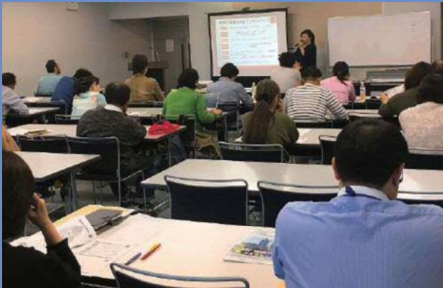
2018 10/13 ビジネスプラン作成セミナー(1日目)