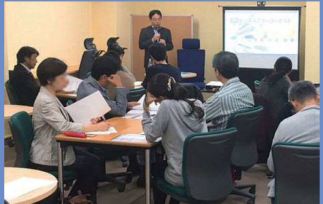
2018 10/24 キックオフ説明会(赤羽会場)