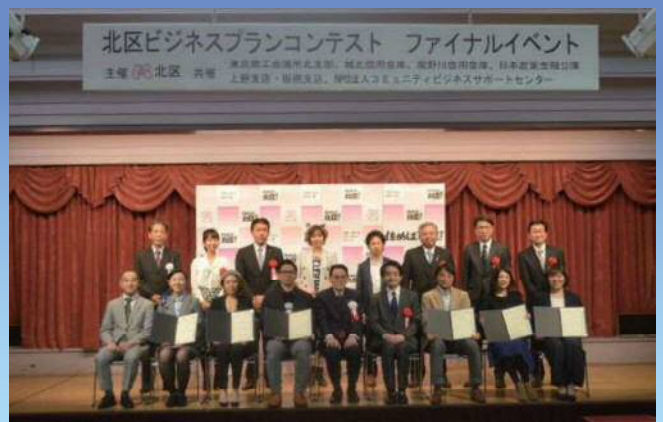
2019 2/2 ファイナルイベント