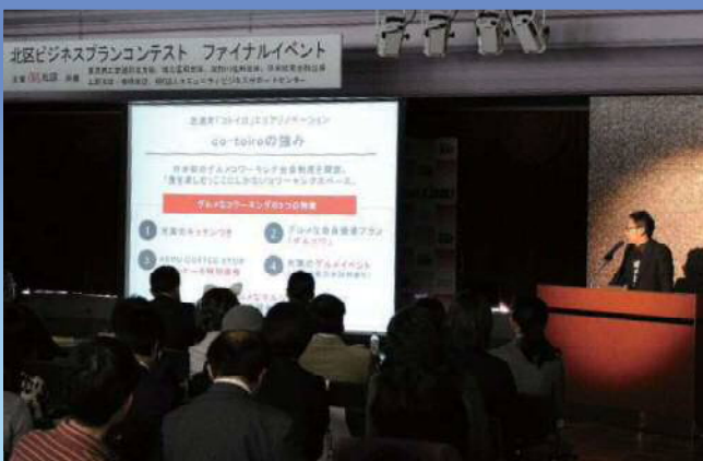
2019 2/2 ファイナルイベント