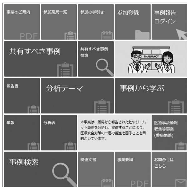
図表IV-1 ホームページのトップ画面

本事業では、事業計画に基づいて、報告書や年報、共有すべき事例、事例から学ぶなどの成果物や、匿名化した報告事例などを公表している。本事業の事業内容の掲載情報については、パンフレット「事業のご案内」に分かりやすくまとめられているので参考にさせていただきたい ( https://www.yakkyoku-hiyari.jcqhc.or.jp/pdf/project_guidance.pdf )。