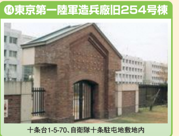
⑭ 東京第一陸軍造兵廠旧254号棟 十条台1-5-70、自衛隊十条駐屯地敷地内