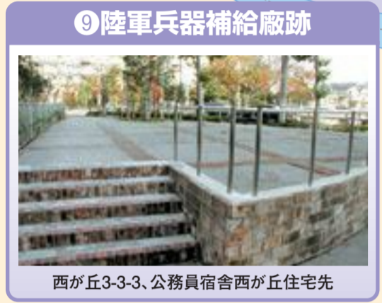
⑨ 陸軍兵器補給廠跡 西が丘3-3-3、公務員宿舍西が丘住宅先