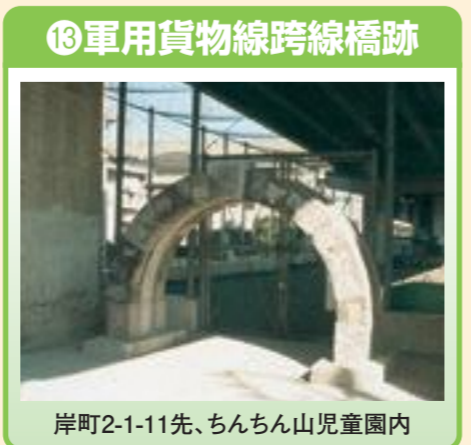
⑬ 軍用貨物線跨線橋跡 岸町2-1-11先、ちんちん山児童園内