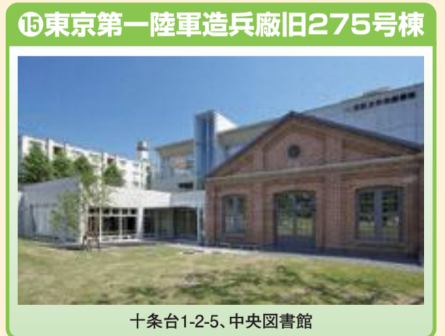
⑮ 東京第一陸軍造兵廠旧275号棟 十条台1-2-5、中央図書館