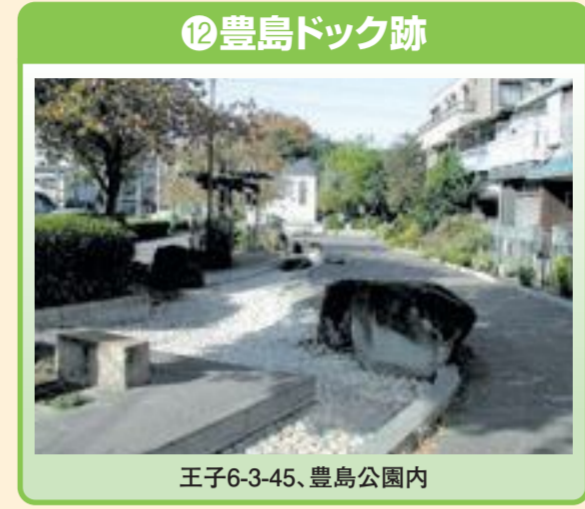
⑫ 豊島ドック跡 王子6-3-45、豊島公園内