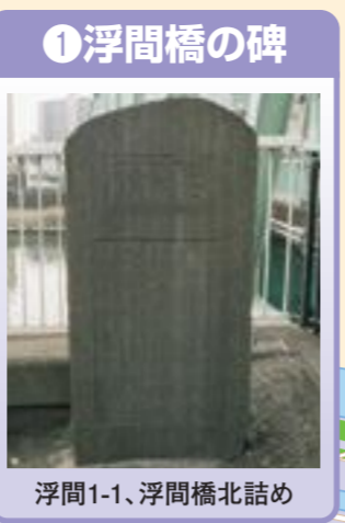
① 浮間橋の碑 浮間1-1、浮間橋北詰め