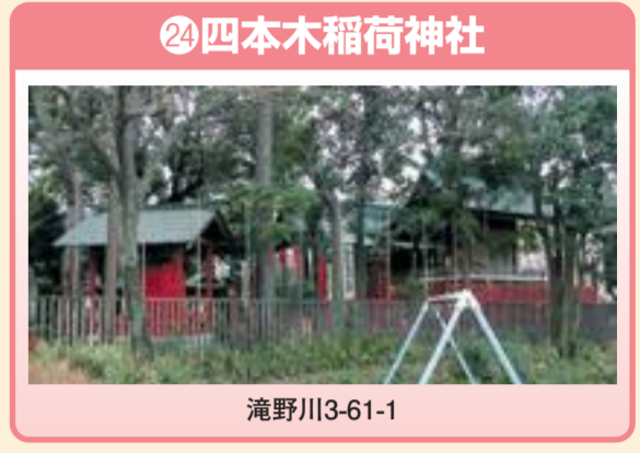
⑭ 四本木稲荷神社 滝野川3-61-1