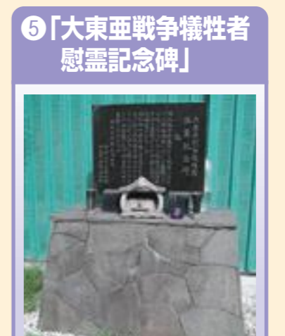
⑤ 「大東亜戦争犠牲者慰霊記念碑」 神谷2-33-6、旧神谷公園