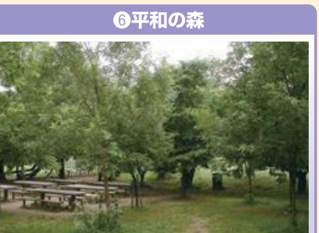
⑥ 平和の森 赤羽台5-2-34、赤羽自然観察公園内