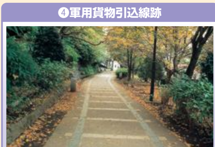
④ 軍用貨物引込線跡 赤羽台3-18-33、赤羽緑道公園内