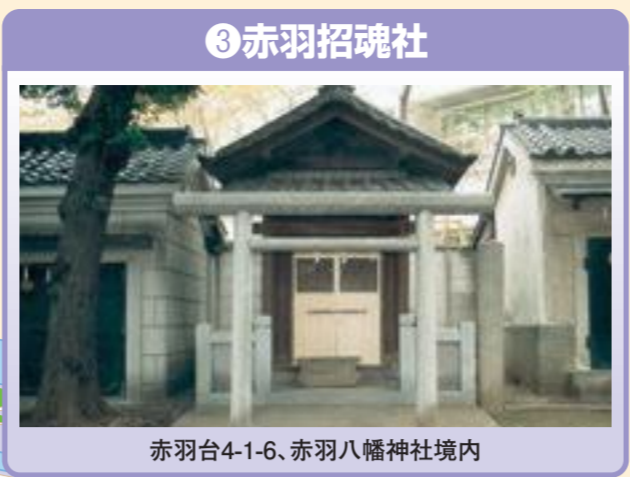
③ 赤羽招魂社 赤羽台4-1-6、赤羽八幡神社境内