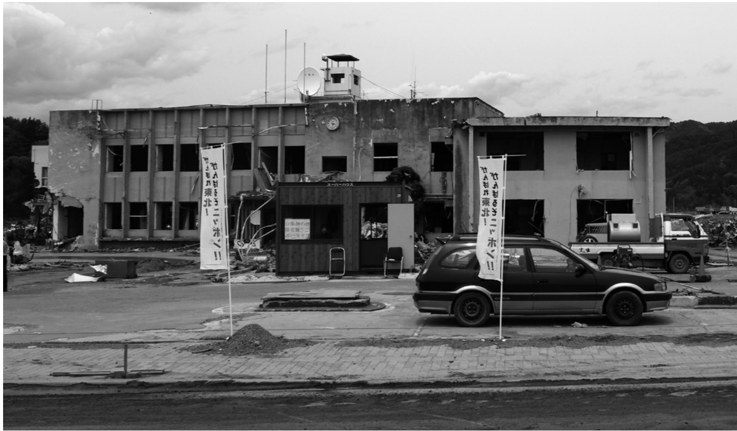
大槌町政府旧址（摄于2011年5月23日）