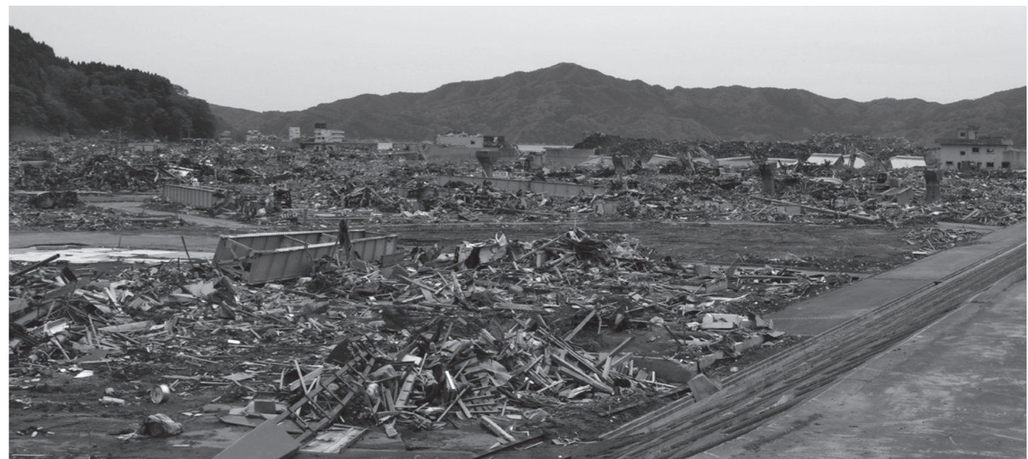
被破坏的村庄(大槌町)(摄于2011年5月23日)