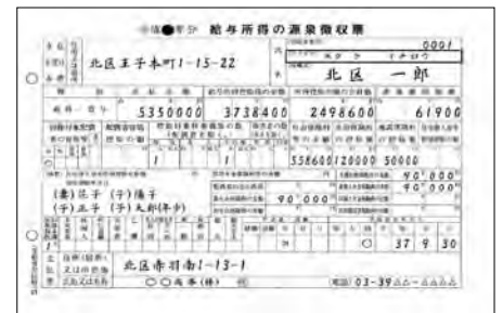
<회사에서 받는 원천징수표>(예)

※ 일본 국외로 진출하거나 귀국할 경우는 본인을 대신하여 납세하는 납세 관리인을 지정해야 합니다.