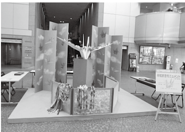
작년의 평화 기념물

작년과 같이 올해도 다양한 행사를 열 예정입니다. 상세 일정은 7월의 키타구 뉴스를 참조해 주십시오.