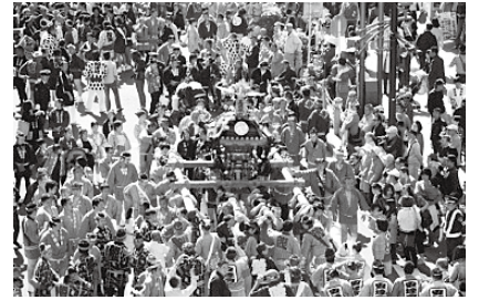
작년의 오미코시 모습

제 1회 개최일인 4월 1일(에이프릴 풀/4월 바보)과 연관지어 ‘아카바네 바보 축제’라 명명되었습니다.