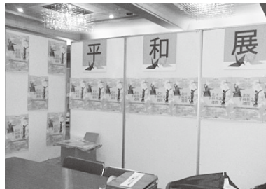
아카바네 회관의 평화전