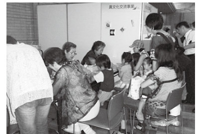
국제 교류 코너