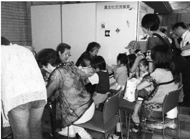
和紙人形コーナー