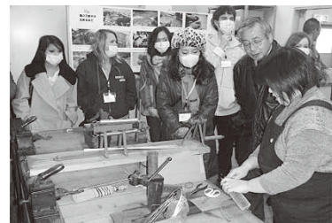
にし おしょうてん たわし つく たいけん 西尾商店で東子を作る体験

2014 ねん 12 がつ ～ 2015 ねん 2 がつ に じっし せいでい 2014年12月～2015年2月に実施予定です、詳しい日程は北区ニュースをご覧ください。