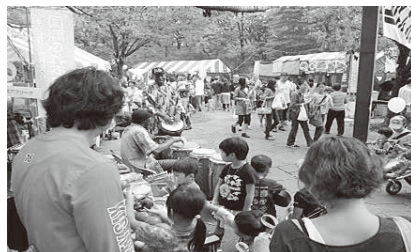
がっき たの ようす アフリカの楽器を楽しむ様子