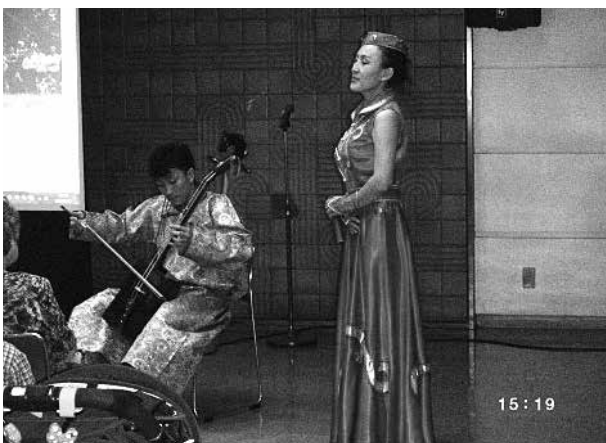
モンゴルの文化交流