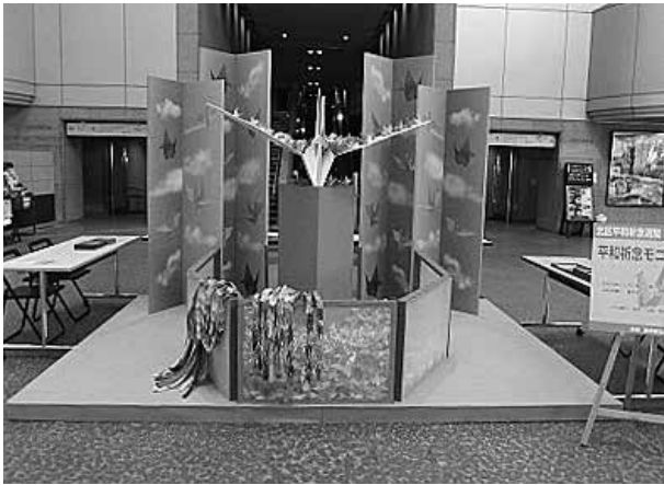
平和祈念モニュメント

毎年、北区平和祈念週間において、たくさんのイベントが行われます。平和祈念コンサート、平和の象徴鶴を折るコーナー、「戦没者追悼の集い」や「すいとんの試食会」のほかに平和・国際交流（異文化交流）として、日本の伝統文化である「お茶会」「和紙人形作り」の体験コーナーもあり、毎年多くの方にお越しいただいております。