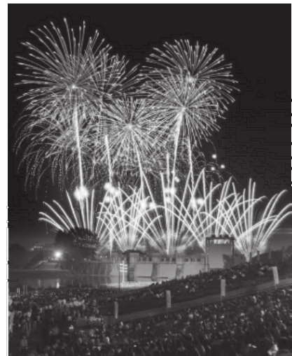
第7回北区観光写真コンテスト

Inquiries: Kita City Fireworks Festival Office 03-6319-3973