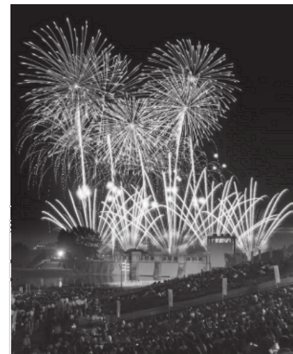
第 7 届北区观光摄影大赛 观光部门议长奖 点亮秋季夜空

제 7 회 기타구 관광 사진 경연대회 관광부문 의장상 가을 하늘을 수놓는다