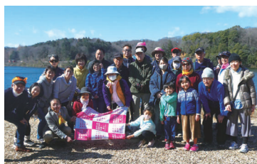
スポーツ推進委員による ノルディックウォーキング

現状 (平成30年度) 32.9% ⇒ 5年後 (令和5年度) 40% ⇒ 10年後 (令和10年度) 45%