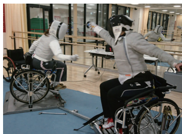
車いすフェンシング教室