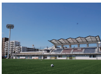
赤羽スポーツの森公園競技場