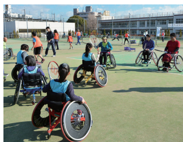
テニスフェスティバル