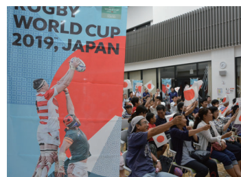
スポーツ観戦事業 (パブリックビューイング)