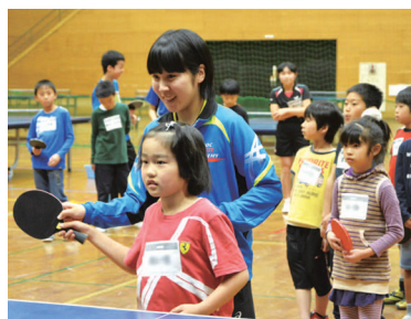
トップアスリート直伝教室