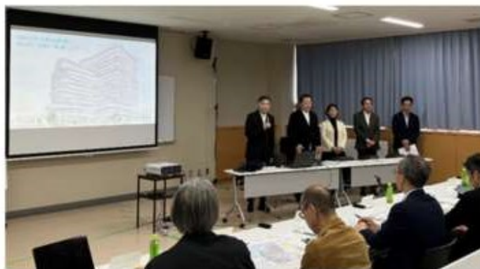
【B者】「整理番号6」 遠藤克彦建築研究所・東畑建築事務所設計共同企業体