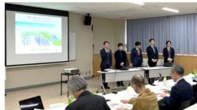
【C者】「整理番号3」 松田平田設計・小堀哲夫建築設計事務所 設計共同企業体