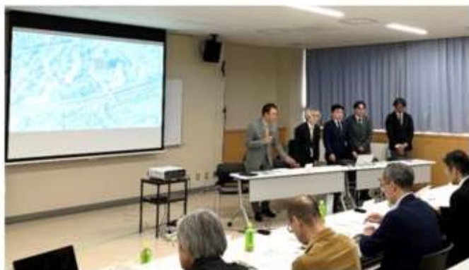
【A者】「整理番号4」 株式会社佐藤総合計画