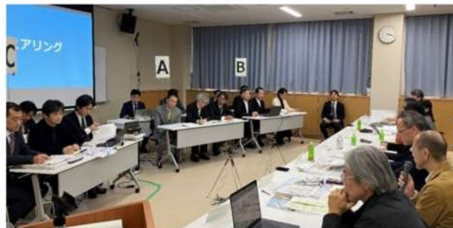
3者同席でのヒアリングの様子