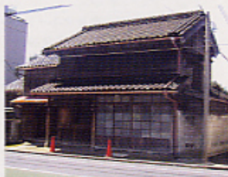
滝野川 榎本宅 滝野川6-11-17