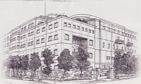
東京成徳学園中学・高等学校本館