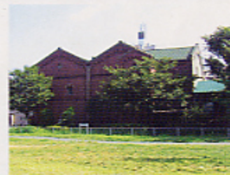
酒類総合研究所 赤レンガ西造工場 滝野川2-6-30