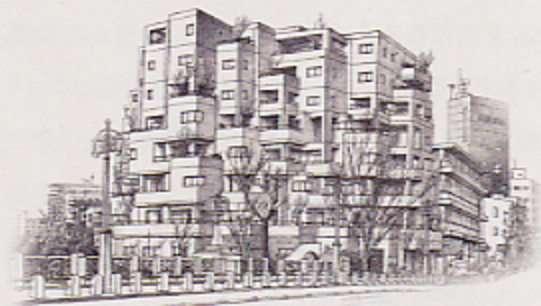
清音園(王子の森集合住宅)

都市景観づくりは、行政だけではなく、区民・事業者と協働で推進する必要があります。「北区景観賞」は、良好な都市景観づくりに寄与する建築物の建築主、設計者、施工者や、都市景観形成に関する活動を推進する団体等を表彰することで、区民・事業者の景観づくりを支援するため、平成14年度に創設されたものです。今回表彰した建築物等を中心に、地域で景観に対する関心が高まることで、より良好な景観づくりが推進されていくことを期待しています。「北区景観賞」は、今後隔年での実施を予定しており、次回「第2回」は平成16年度を予定しています。