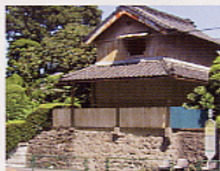
浮間 清水宅 浮間2-13-1

「近年に完成した建築物等を表彰し、現在活躍している事業者等を支援する」という景観賞の主旨に沿わない部分もあり表彰の対象にはなりませんでしたが、区民審査でも多くの支持を集め、選考委員会でも「重要な景観資源として大切に保全してほしい」との高い評価がされました。