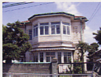
東田精器株式会社 事務所 志茂5-30-7