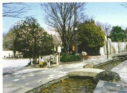
① 北区西ヶ原2-1-8 ② 北区役所道路公園課 TEL. 03(3908)9275

花や実のなる木を中心とした豊富な緑と、大きな滝のある池や川が、心休まるうらおいの景観をつくりあげています。また、この周辺は、御殿前遺跡と呼ばれ、昭和57年、都内で初めて郡衙(郡の役所)が発掘されました。