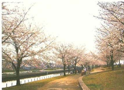
① 北区赤羽3-29先、岩淵町41先 ② 北区役所道路公園課 TEL. 03(3908)9275

荒川と新河岸川の間にある土手につくられた歩道状の緑地です。S字状の歩道の両脇には約110本もの桜が植えられています。川と緑が調和して、とても心地のよい景観をつくりあげています。