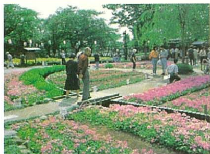
① 北区浮間2-30(都立浮間公園内) ② 北区役所産業振興課 TEL. 03(5390)1234 ③ 4月中旬～下旬まで 午前9時～午後4時30分

現在の園場は、旧園場の隣に平成元年にオープンしたもので、かつて桜草の自生地として有名だったこの地域の面影を今に伝えています。一般公開の時期には、遠方からもたくさんの人たちが、きれいな花を見に訪れます。